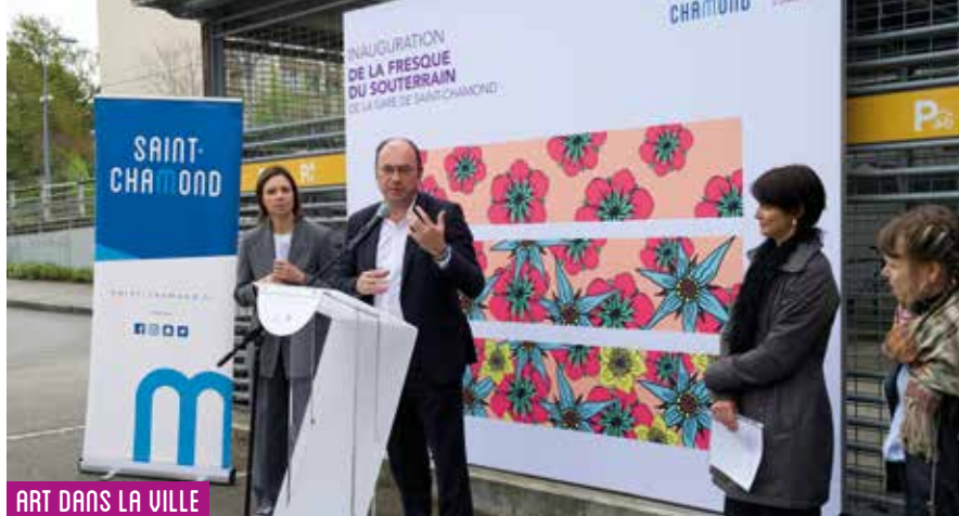
ART DANS LA VILLE

"C'est une belle initiative qui donne une touche de gaieté à la gare. J'espère que cette œuvre restera propre longtemps. J'aimerais bien voir d'autres fresques de ce type dans les rues de la ville."