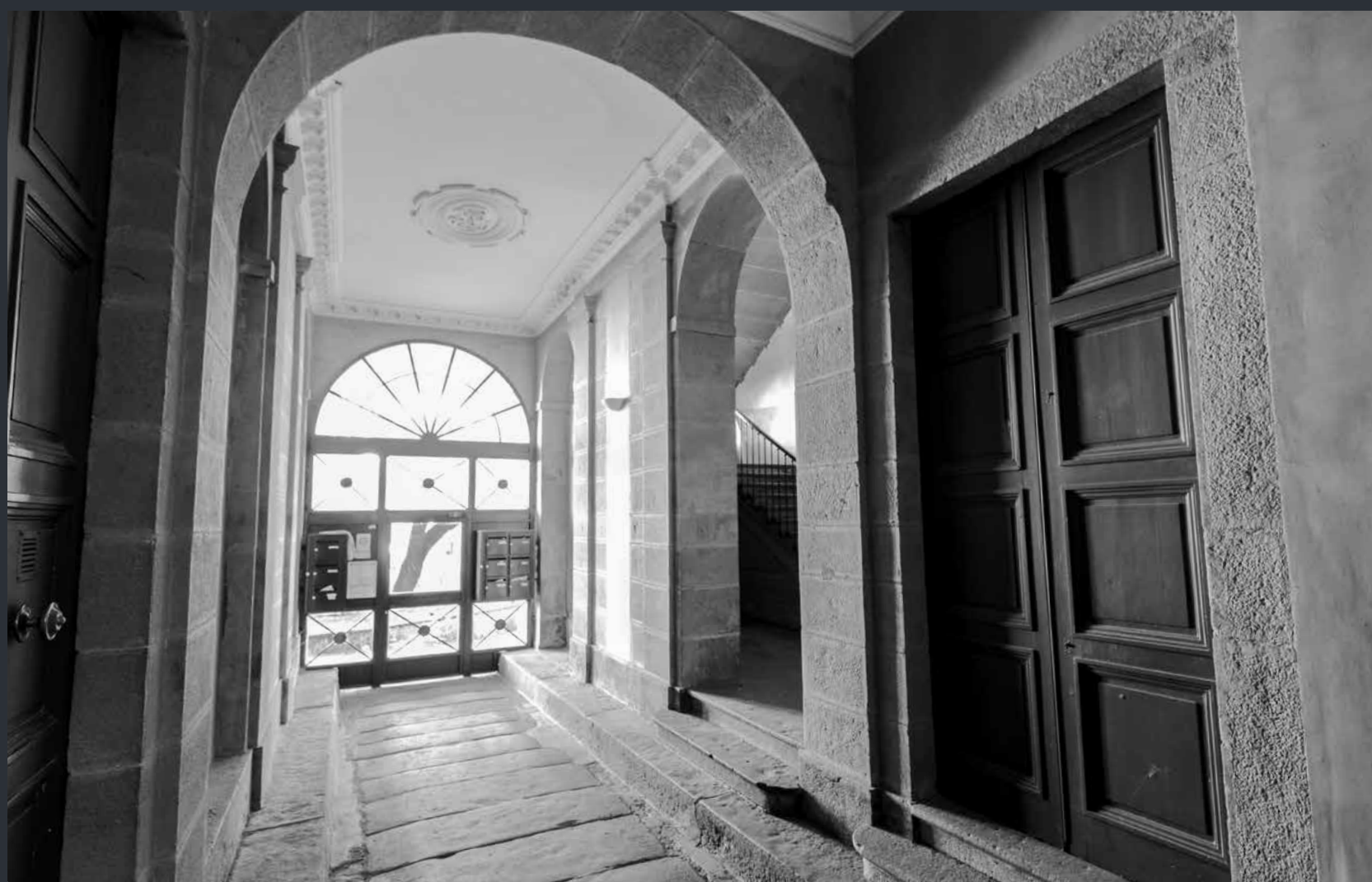
Donnant sur la route royale 88, principale voie commerciale entre Lyon et Saint-Étienne, le passage cocher permettait l'accueil de riches négociants et le départ des cargaisons de rubans.