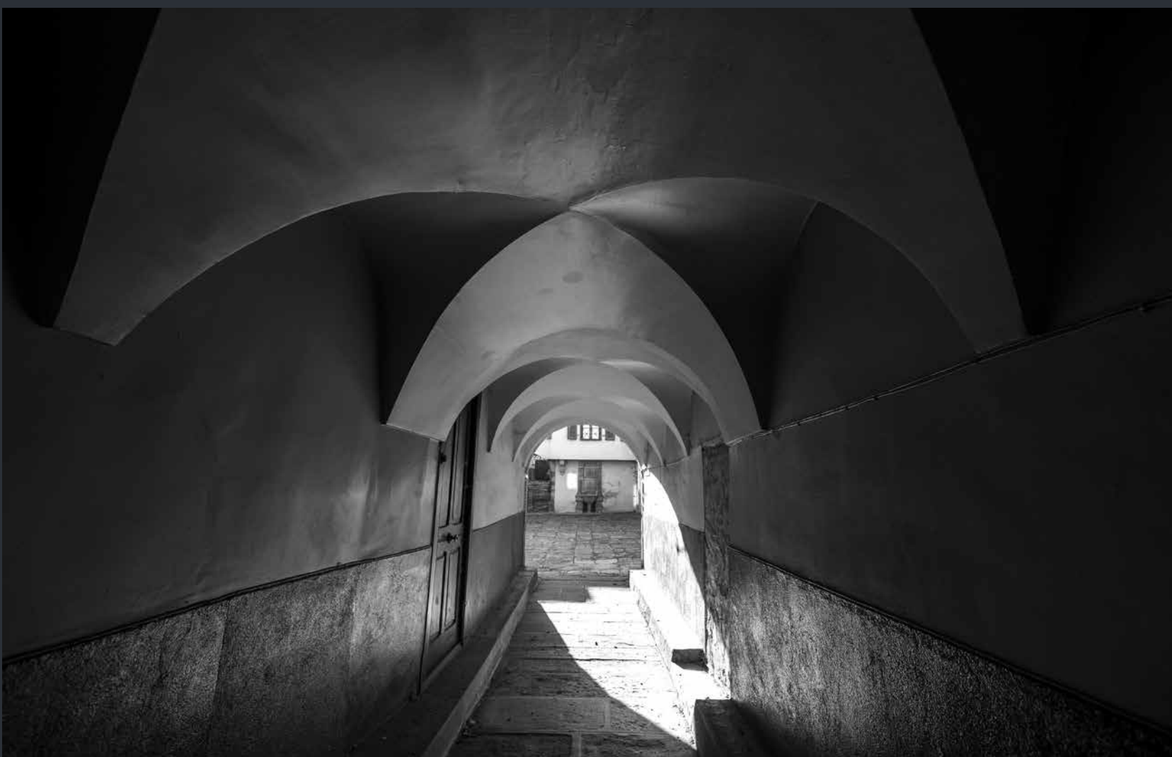
Vouté d'arrêtes, un passage cocher ouvre encore sur la cours pavée de l'hôtel.

À l'arrière de l'hôtel, la grille du XVIII e permettait l'accès aux communs et à un vaste parc. Comportant verger, potager, orangerie et jeu de croquet, celui-ci pourvoyait aux besoins de la famille et de ses domestiques, tout en concourant au prestige de la maison Guérin.