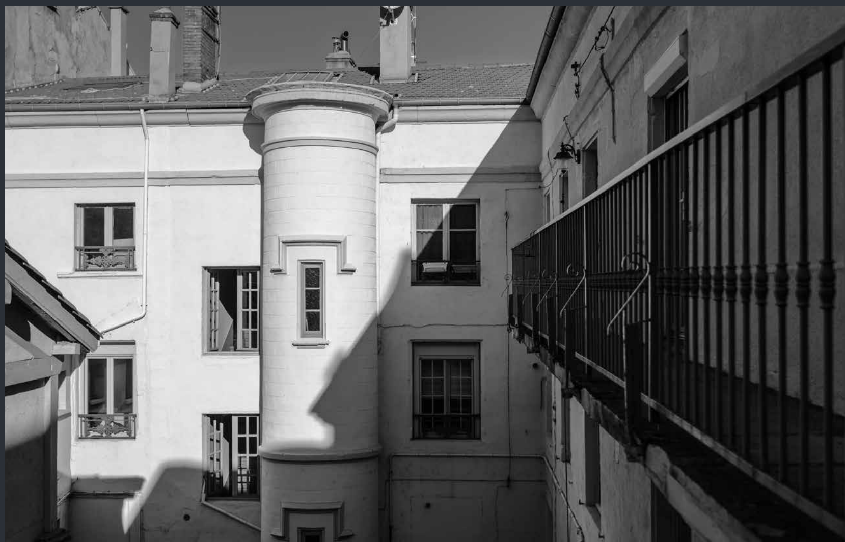
Dans la cour intérieure, une tour est décorée de larmiers, bandeaux saillants destinés à éloigner du mur et des baies le ruissellement des eaux.

Symétrie, baies cintrées et pierres en bossage fixent l'hôtel dans le néoclassicisme du XVIII e . En face aux n°38 et 36, avec leurs corniches moulurées et à modillons, les hôtels bâtis pour la famille Neyrand suivent la tendance.